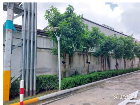
รูปที่ 1.5-1 สถานะปัจจุบันของโครงการ